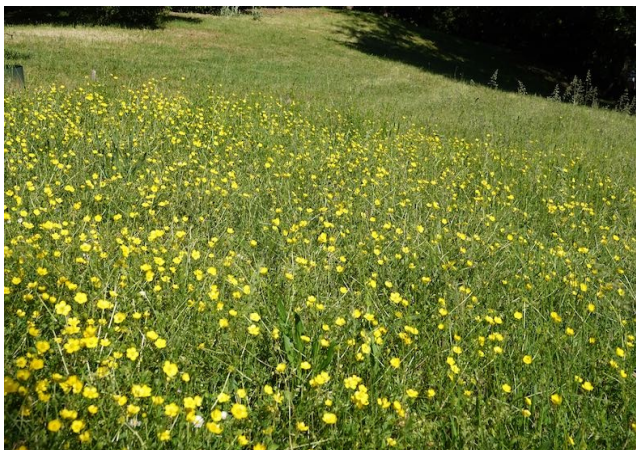
Wiese mit Hahnenfuß

Heute bin ich in Landau unterwegs und habe mir als Ziel für interessante Vogelbeobachtungen die Reiterwiesen ausgesucht. Ich starte am Westbahnhof. In dem kleinen Park steht eine mächtige Blutbuche, in der ich mindestens drei Nester von Saatkrähen entdecken kann. In der Nähe ruft ein Grünfink . Ein Teil der Wiese neben mir wurde nicht gemäht und blüht strahlend gelb vom Hahnenfuß. Diese Fläche gehört zu einem Projekt, das Landauer Studenten ins Leben gerufen haben, damit sich mehr blühende Wiesen auch in der Innenstadt entwickeln können. Ich finde das eine gute Idee, denke aber das die Umsetzung in einem noch viel größeren Umfang stattfinden konnte, als es bisher der Fall ist.